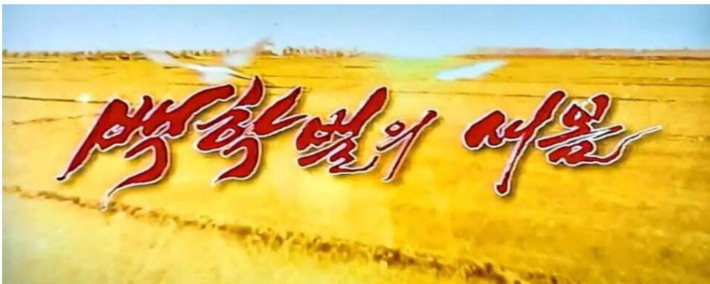
22集电视连续剧《白鹤田野的新春》(백학벌의새봄)

作者：李春日，中国亚洲经济协会副会长、延边大学朝鲜韩国研究中心特聘研究员 来源：东北亚研究通讯