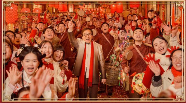
浙江义乌分会场《世界义乌中国年》