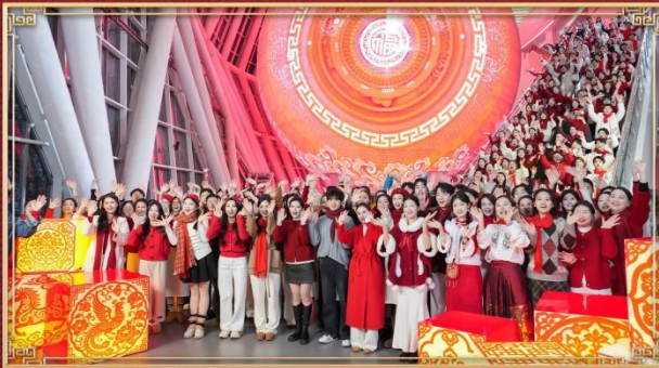
安徽合肥分会场《合韵满江淮》