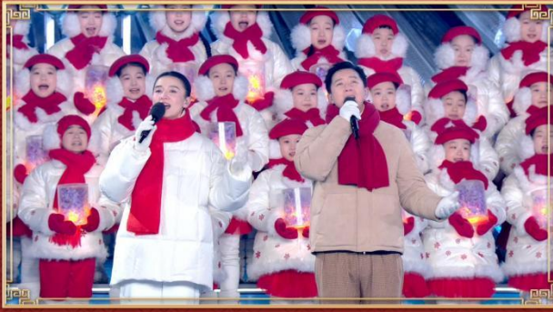
黑龙江哈尔滨分会场《冰雪暖世界》